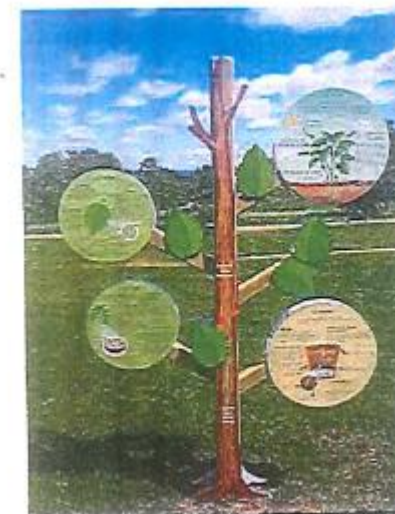
Totem fonctionnement arbre